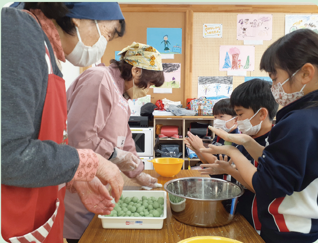
▲子どもたちにだんごの作り方を教えています