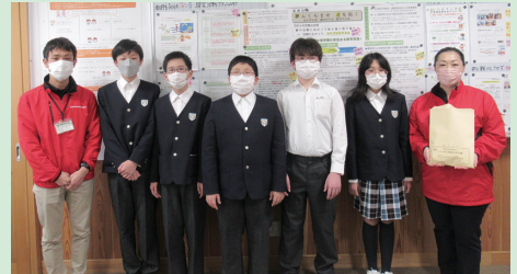
▲学校募金（いいたて希望の里学園）

今回、お寄せいただいた募金は、福島県内の福祉事業や村の地域福祉事業等に活用させていただきます。