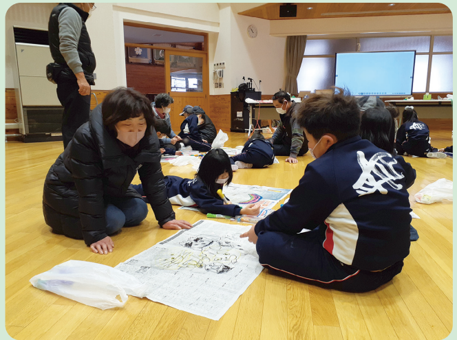
▲子どもたちは好きな絵を凧に描いています