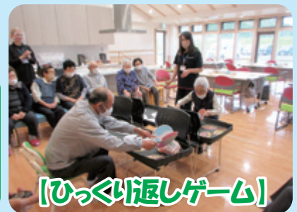
【ひっくり返しゲーム】