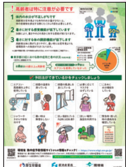
▲塩タブレット（左）と高齢者のための熱中症対策のチラシ（右）を配付しました