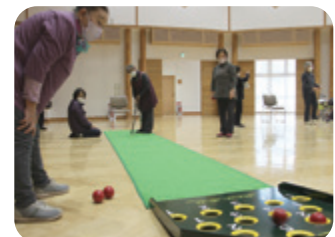
(身体障がい者福祉会レクリエーション交流会)