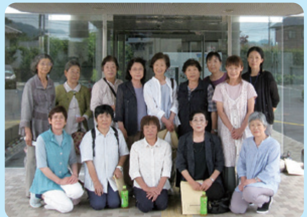
▲相馬市と飯舘村の団員のみなさん

7月3日に視察研修会を実施し、団員7名が参加しました。相馬市赤十字奉仕団を訪れ、お互いの活動状況等について情報交換しながら交流しました。その後、相馬市より南下し海岸沿いの復興状況を車窓より視察し、双葉町では東日本大震災原子力災害伝承館に立ち寄り、当時のことを振り返りながら見学しました。今回の研修を通して、団員の活動意欲を高める機会となりました。