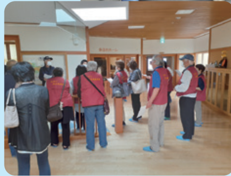
地域防災センターで村担当者より説明を受けている様子