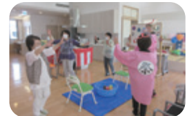
(サポートセンター)