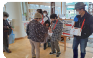
(共同募金委員会イベント募金)