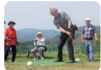
(老人クラブ連合会パークゴルフ大会)