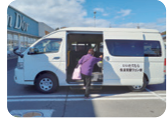
(生活支援ワゴン運行事業)