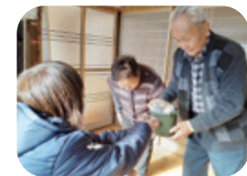
(村内見守り訪問活動)