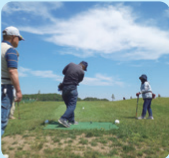
▶各ホールを回りながらプレーを楽しむ参加者