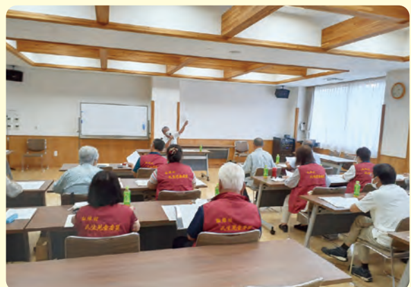
講師(中央)の話に耳を傾けています