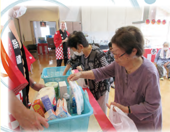
的当てゲームの景品として食器用洗剤などの日用品を準備し、好きなものを選んでいきます