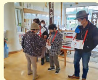
イベント募金の様子 (令和4年度いいたて村文化祭)