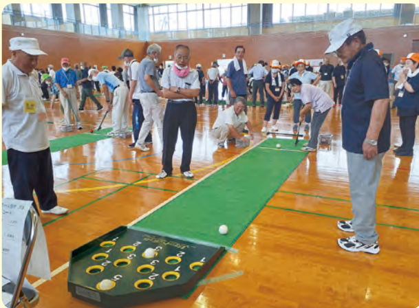
スカットボール・得点穴を狙ってボールを打っています

8月1日、浪江町地域スポーツセンターにて浜通り地区ニュースポーツ交流会が開催され、13市町村14チームが参加し飯舘村からは1チームの19名が参加しました。囲碁ボール、スカットボール、ポッチャの3種目が行われ、それぞれの部門で得点を競い合いました。今年は、昨年の悔しさもあり、種目ごとに練習を積み重ねて大会に挑みました。その結果、スカットボールの部で第3位となり、総合での入賞は逃しましたが、「来年こそ優勝を目指す」と来年の大会に向けて意欲を見せていました。