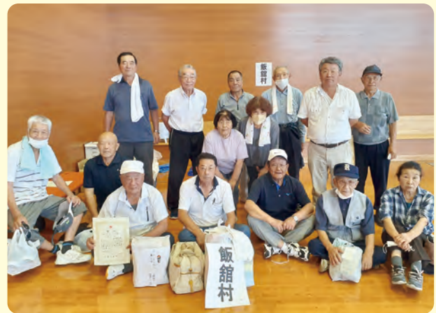
表彰式後参加者のみなさんで記念撮