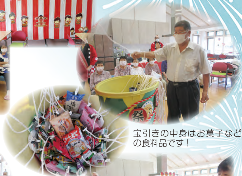
宝引きの中身はお菓子などの食料品です！