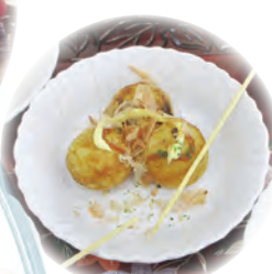
最後はみんなでたこ焼きを食べました