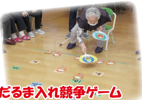
だるま入れ競争ゲーム