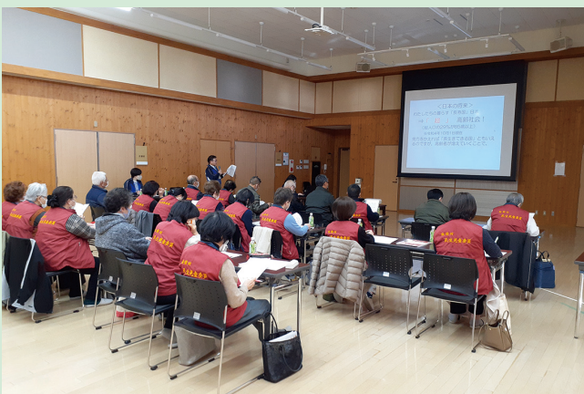
▲皆さん真剣に耳を傾けていました

また、1月下旬から2月上旬にかけて各担当地区の民生委員が対象者(75歳以上の一人暮らし高齢者など)に「こころの手紙」を送付しました。(写真右下)