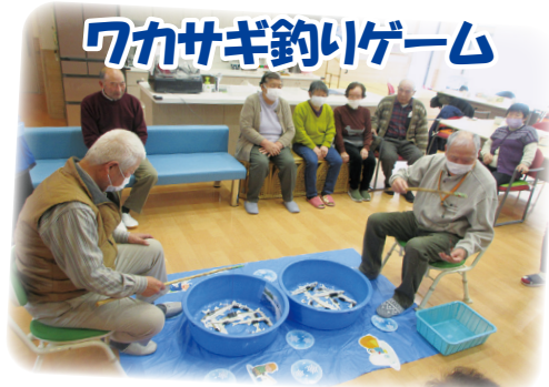
ワカサギ釣りゲーム