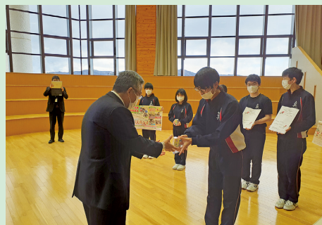
学校募金 (いいたて希望の里学園)

今回、お寄せいただいた募金は、福島県内の福祉事業や村の地域福祉事業等に活用させていただきます。