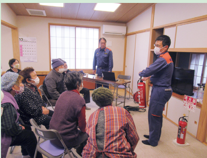
飯館分署職員による「防災・防犯講話」が行われました。