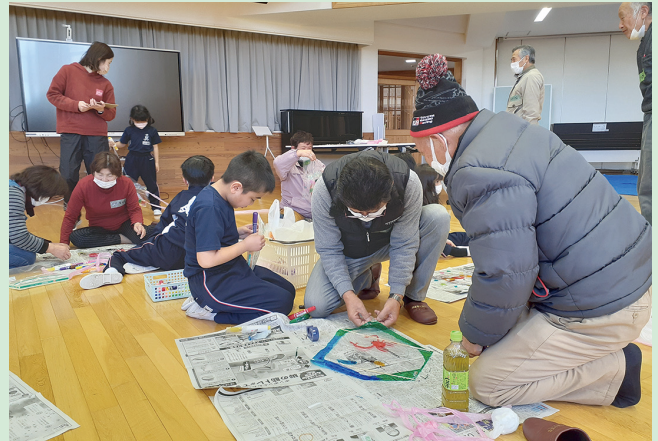
▲凧に絵を描き、オリジナルの凧を完成させました