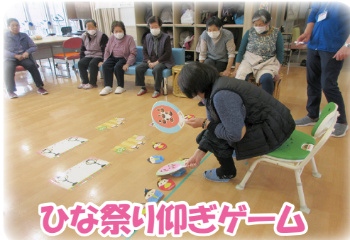
ひな祭り仰ぎゲーム