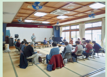
月1回永井川集会所に各地から集り開催されています。