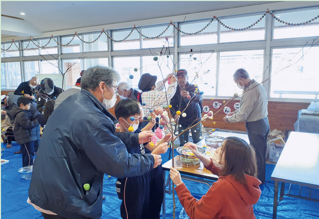
▲ミズキの木にだんごなどを飾り付けました