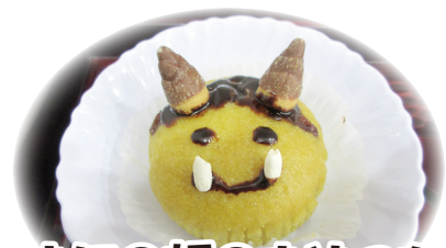
おにの顔のおやつを食べました!