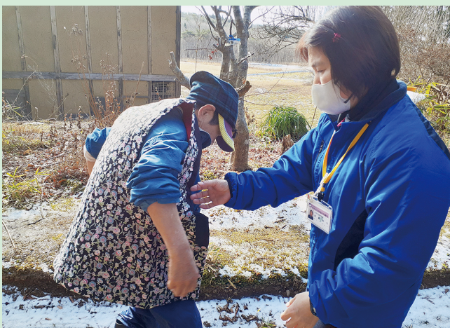
▲その場ではんてんを着ていただきました