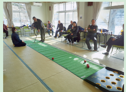
毎回スカットボール等のゲームを楽しんでいます。