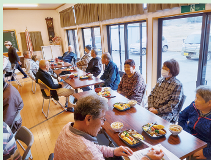
婦人会が中心となり昼食を準備し、食事をしながら交流しています。