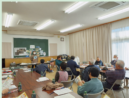
歯科衛生士による「口腔ケア教室」を実施しました。