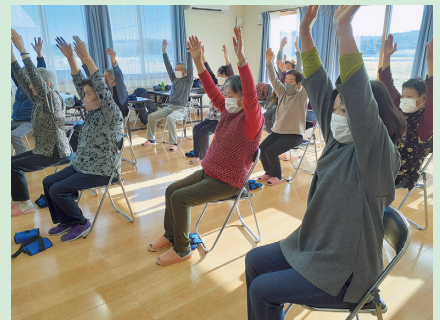
生活支援相談員とともに「百歳体操」をやっています。