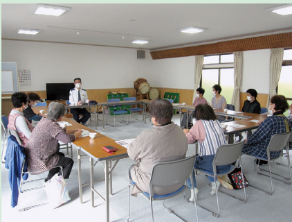
駐在所の協力により「交通安全・防犯講話」が行われました。