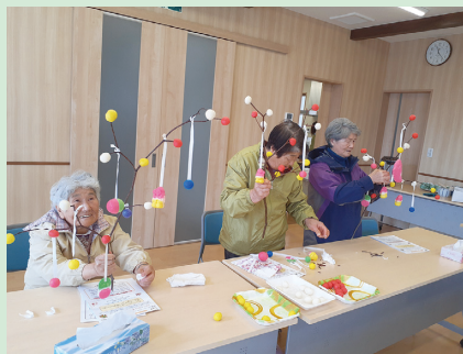
1月はだんごさが行われ、自由に飾り付けをしました。