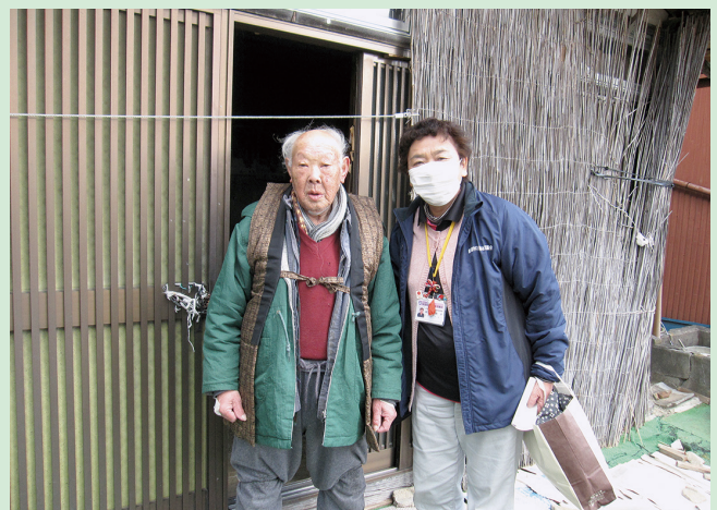
▲はんてんを着用し、生活支援相談員と記念撮影