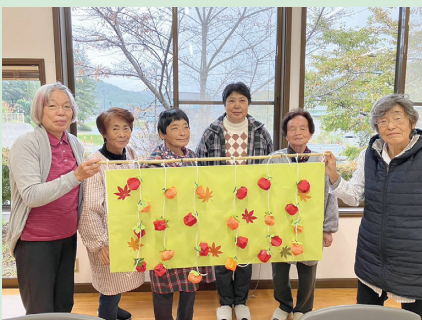
村文化祭への作品出展に向けて作品作りをしました。